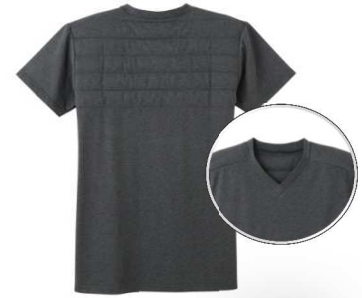
品名：半袖V首Tシャツ 品番：WJ1015 希望小売価格：¥2,800+税 サイズ：M/L/LL カラー：ブルーモク/ブラックモク/ レッドモク/サンドイエロー