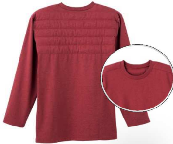
品名：長袖丸首Tシャツ 品番：WJ1008 希望小売価格：¥3,000+税 サイズ：M/L/LL カラー：ブルーモク/ブラックモク/ レッドモク/サンドイエロー

「WONDER WARM®」は軽くて防寒性があり、アウターにひびきにくいインナーウェアです。トレンド感のあるシルエットを採用し、日常使いからレジャー・アウトドアなど様々なシーンでの着用在が広がるデザインにしました。冬らしい温かみのあるカラーバリエーションで展開します。