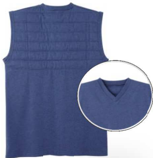
品名：ベスト 品番：WJ1018 希望小売価格：¥2,500+税 サイズ：M/L/LL カラー：ブルーモク/ブラックモク/ レッドモク/サンドイエロー