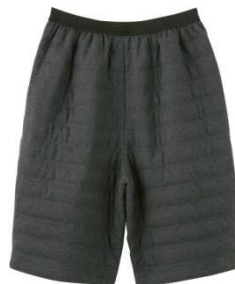
品名：ハーフパンツ 品番：WJ1007H 希望小売価格：¥4,000+税 サイズ：M/L カラー：ブルーモク/ブラックモク/ レッドモク