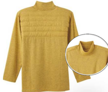
品名：長袖ハイネックTシャツ 品番：WJ1010 希望小売価格：¥3,000+税 サイズ：M/L/LL カラー：ブルーモク/ブラックモク/ レッドモク/サンドイエロー