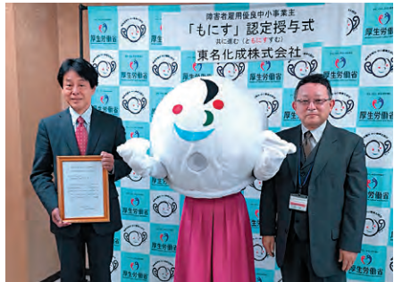
▲認定書を受領する相徳社長（左）